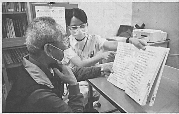
電話で人工知能を用いた発音指導を受ける言語聴覚士中心

言語聴覚士による「話す、聞く、食べる」リハビリテーションは、「話す」「聞く」といったコミュニケーションの障害や、食生活の改善、食べ物の摂取量の向上、咀嚼力の向上、嚥下障害の改善など、幅広い分野で活躍しています。また、コミュニケーションの障害や、食べ物の摂取量の向上、咀嚼力の向上、嚥下障害の改善など、幅広い分野で活躍しています。 「自分らしい生活」を送る支援には、コミュニケーションの障害や、食べ物の摂取量の向上、咀嚼力の向上、嚥下障害の改善など、幅広い分野で活躍しています。